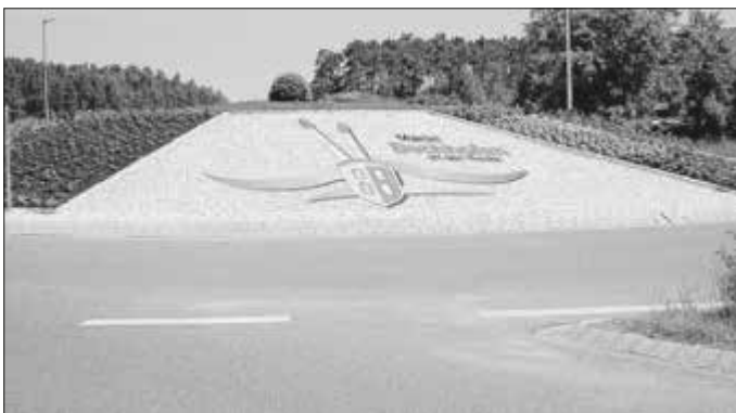
Fotomontage Kreisverkehr Fröschau

Das Regionalbudget wird mit Mitteln der Bundesrepublik Deutschland aus dem GAK-Rahmenplan und auf Initiative des Bayerischen Staatsministeriums für Ernährung, Landwirtschaft und Forsten über das Amt für Ländliche Entwicklung Mittelfranken gefördert. Innerhalb des ILE-Zusammenschlusses „Altmühl-land A6“ (Arberg, Aurach, Bechhofen, Burk, Burgoberbach, Dentlein am Forst, Dombühl, Herrieden, Leutershausen, Wieseth) konnten im Frühjahr nach öffentlicher Ausschreibung in den Mitteilungsblättern Interessierte (z. B. Vereine, Privatpersonen, Kommunen) einen Förderantrag zur finanziellen Unterstützung ihrer Kleinprojekte (Investition zwischen 500 und 20.000 Euro netto) stellen. Die Zuschussquote liegt bei bis